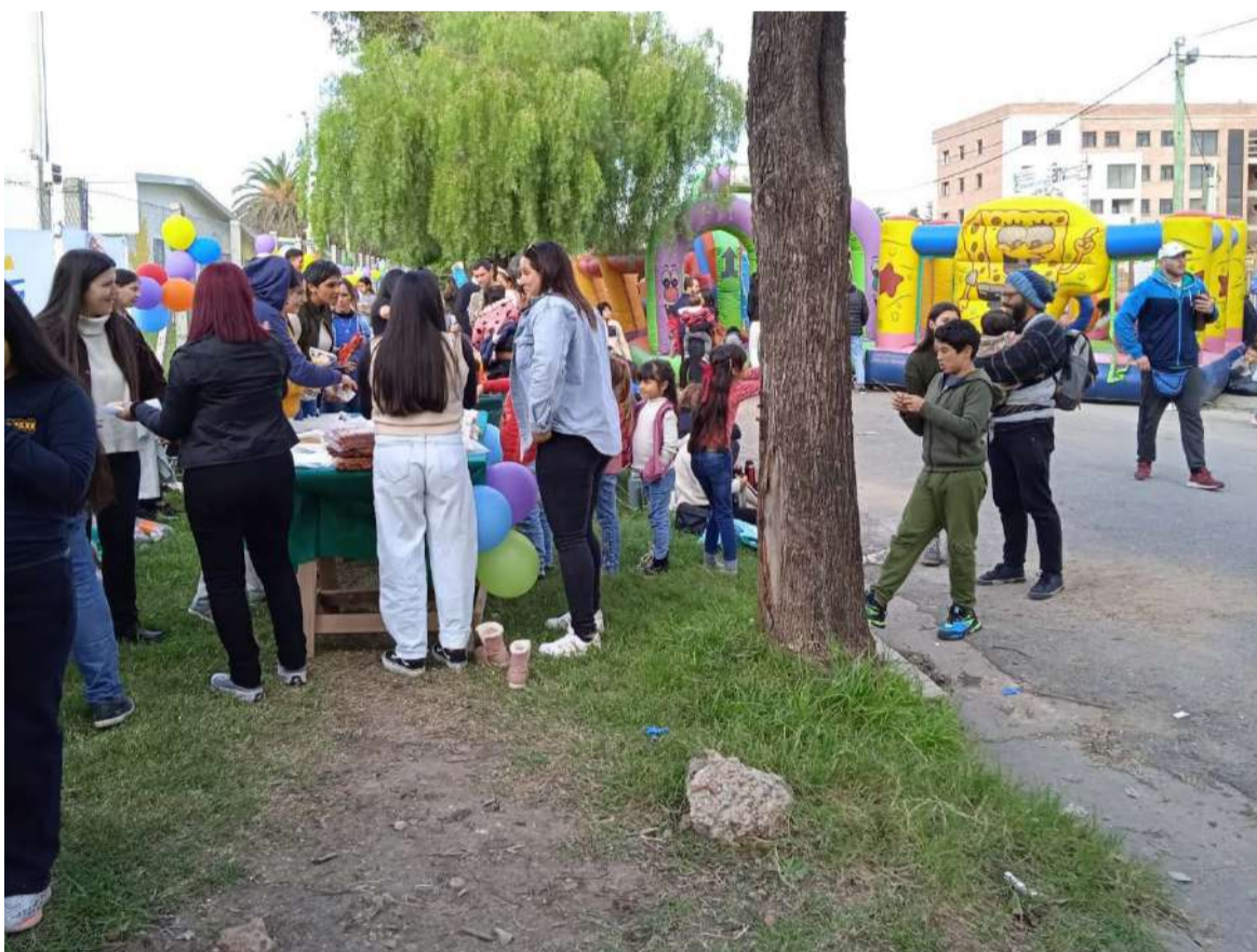
El Fondo Social del Sunca realizó el domingo 20 una jornada de integración con las cooperativas del proyecto Paylana. Fue sobre Meriggi. Una buena iniciativa sindical que incluyó juegos, panchos, y refrescos para los más menudos.