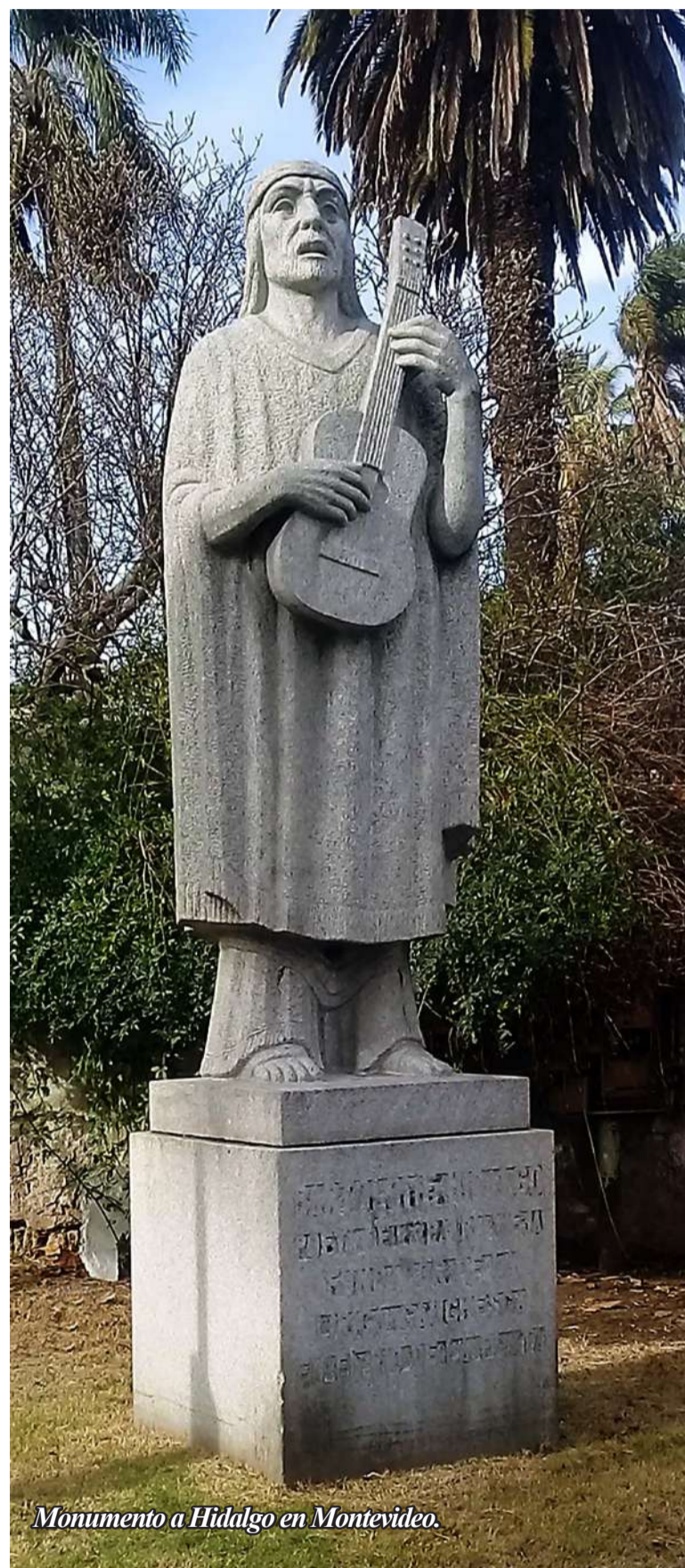
Monumento a Hidalgo en Montevideo.

Más allá de su presencia en las "Criollas" de todo el país, en nuestra ciudad se solían concretar imperdibles encuentros de payadores, organizados por el Círculo Policial. El lugar físico fue el Estadio Cerrado Municipal. Eran payadas de contrapunto, un jurado otorgaba puntajes y de allí salían los ganadores. Claro: al culminar y en una demostración de compañerismo y amistad, compartían los premios en efectivo alcanzados. En dos ediciones, nos tocó animar o conducir aquellos festivales.