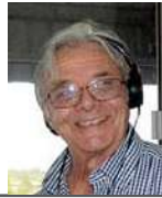
Escribe Francisco Debali