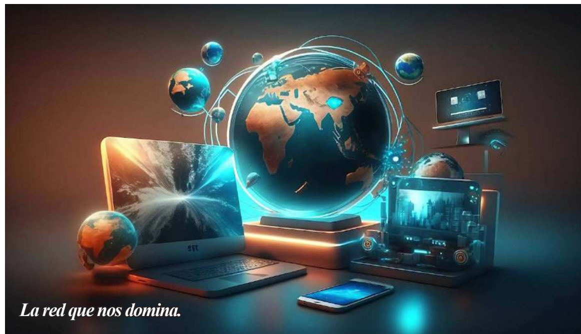
La red que nos domina.

Hablar de cómo el uso de los celulares ha deteriorado la intimidad, la cortesía o la discreción, de las serias dudas que están surgiendo respecto del uso de ellos y otros aparatos digitales en la educación o de cómo el acto social que significaba ir al cine o a un concierto ha desaparecido bajo el impacto de Netflix o la música "on line"