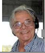
Escribe Francisco Debali