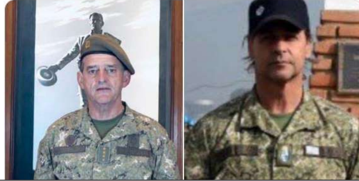
La diaria verifica. Foto del artículo 'Es verdadero que Uruguay tiene el mayor gasto militar per cápita de América Latina?'

Uruguay tiene el mayor gasto militar per cápita de Latinoamérica NO teniendo conflictos bélicos. El gasto militar ha aumentado desde 1990, hoy es el doble de lo q gastan Brasil, N. Zelanda, Canadá, Finlandia, Alemania o España-La mitad va a retiros y pensiones, cifra única en el mundo: