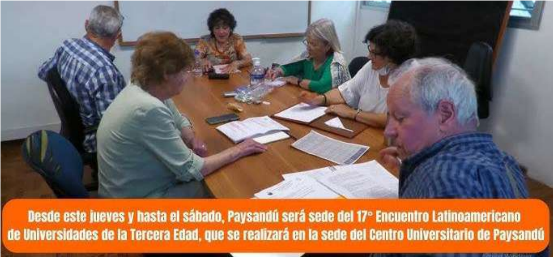
Desde este jueves y hasta el sábado, Paysandú será sede del 17° Encuentro Latinoamericano de Universidades de la Tercera Edad, que se realizará en la sede del Centro Universitario de Paysandú

El XVII Encuentro Latinoamericano de Universidades Abiertas se realizará en la sede Paysandú del Cenur Litoral Norte desde hoy jueves hasta el próximo sábado.