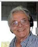
Escribe Francisco Debali